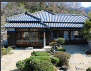
主屋(料亭時代のたたずまいを残した和室、内部見学可能) ※館内スタッフまでお申し出ください

主屋、長屋棟、離れ3棟、木戸門があり、主屋は講座等を行う学習室や休憩場所として活用しています。離れの1棟は菱形の建物で茶室として改修しています。令和3年2月に、建物全体が国登録有形文化財となりました。