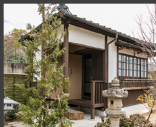
茶室(武田菱をイメージした菱形の建物)